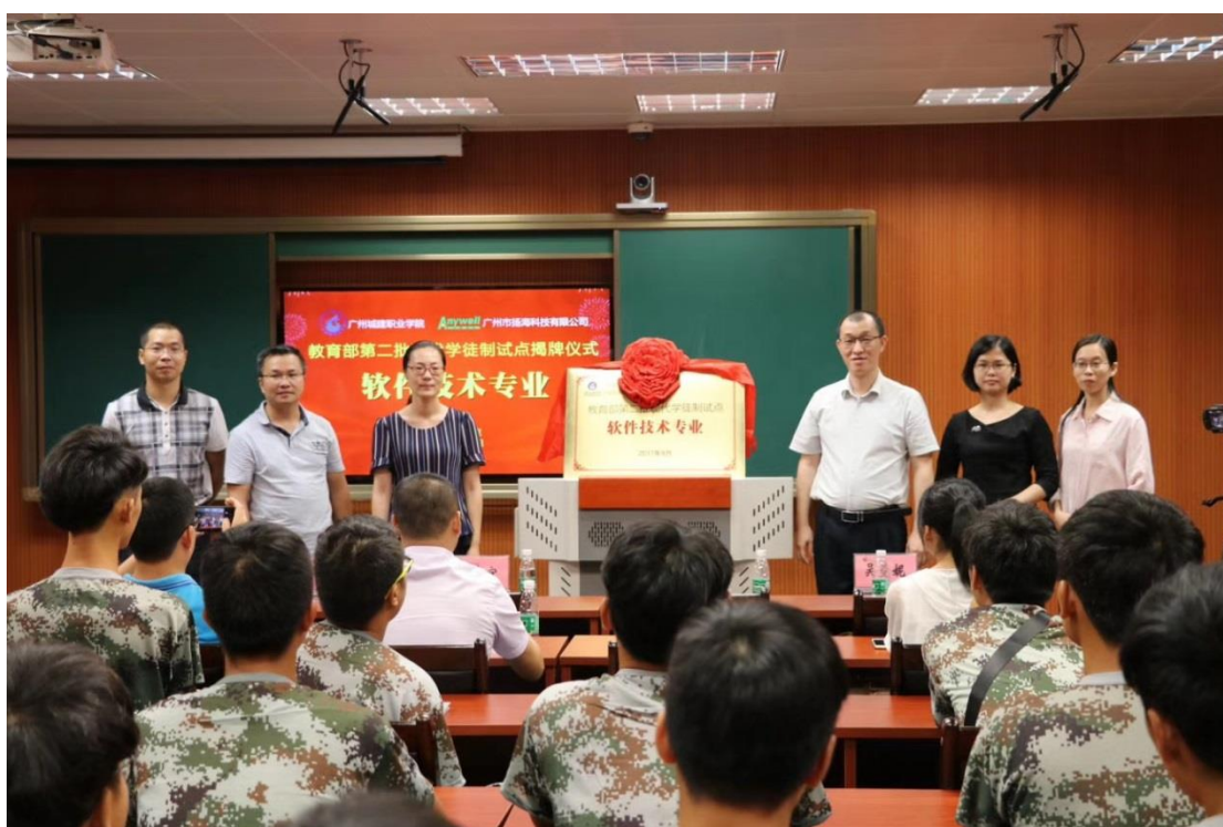
校企领导为软件技术教育部第二批现代学徒制试点专业揭牌